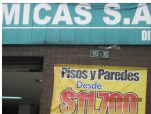
Foto 3. Dirección de la Publicidad