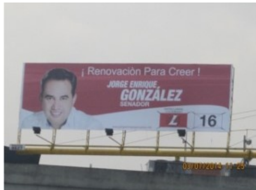
Foto 2. Texto de la Publicidad