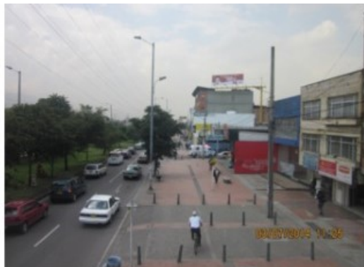
Foto No 1. Vista Panorámica N - S